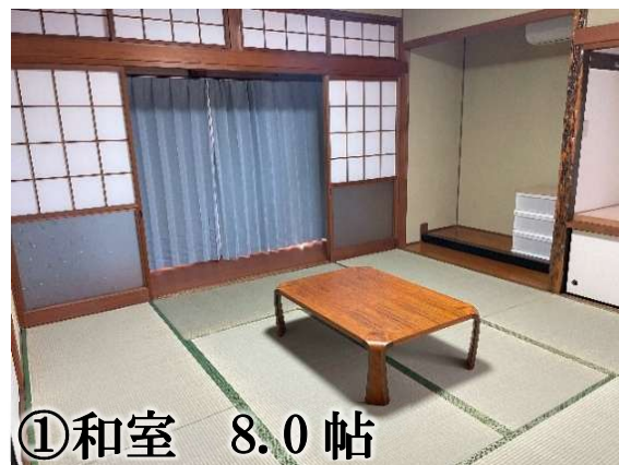
①和室 8.0 帖