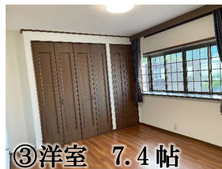
③洋室 7.4 帖