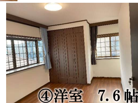
④洋室 7.6 帖