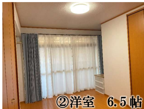
②洋室 6.5 帖